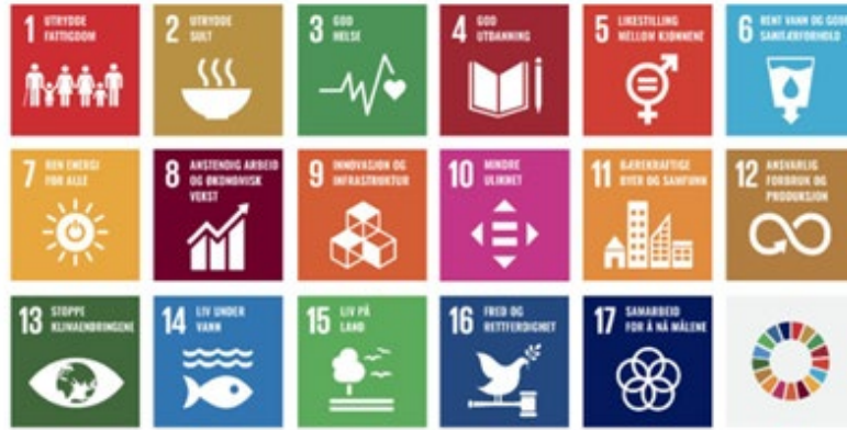
Figur 1 FNs bærekraftsmål ble vedtatt i 2015

bærekraftsmål, som Norge har sluttet seg til, skal være det politiske hovedsporet for å ta tak i vår tids største utfordringer, også i Norge. For å fremme sosial, miljømessig og økonomisk bærekraft er det viktig at