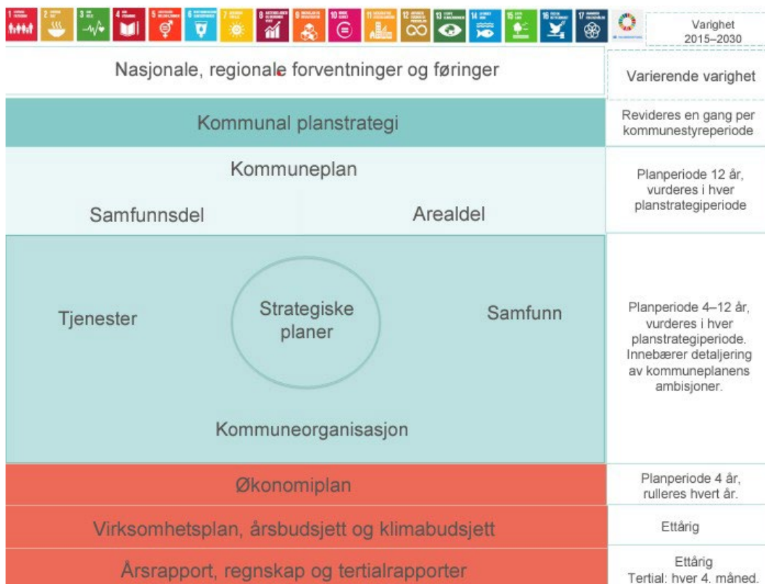
Figur 3 Plansystemet til Røros kommune

Det skal være en forbindelse hele veien fra FNs bærekraftsmål, via regjeringen og de nasjonale og regionale føringene, gjennom kommuneplanen, de strategiske planene, budsjett og økonomiplan til virksomhetsplanene. Dette er komplekse sammenhenger i plansystemet, og det er viktig å ikke gå seg vill i detaljer. Vi ønsker å sikre en helhetlig styring som gir handlingsrom og tillitt til innovasjon i gjennomføringen av prosessene. Vi må enkelt og tydelig beskrive retningen vi skal gå, og unngå detaljerte tiltaksplaner. Forslag til tiltak legges fram i forbindelse med budsjettplanprosessene.