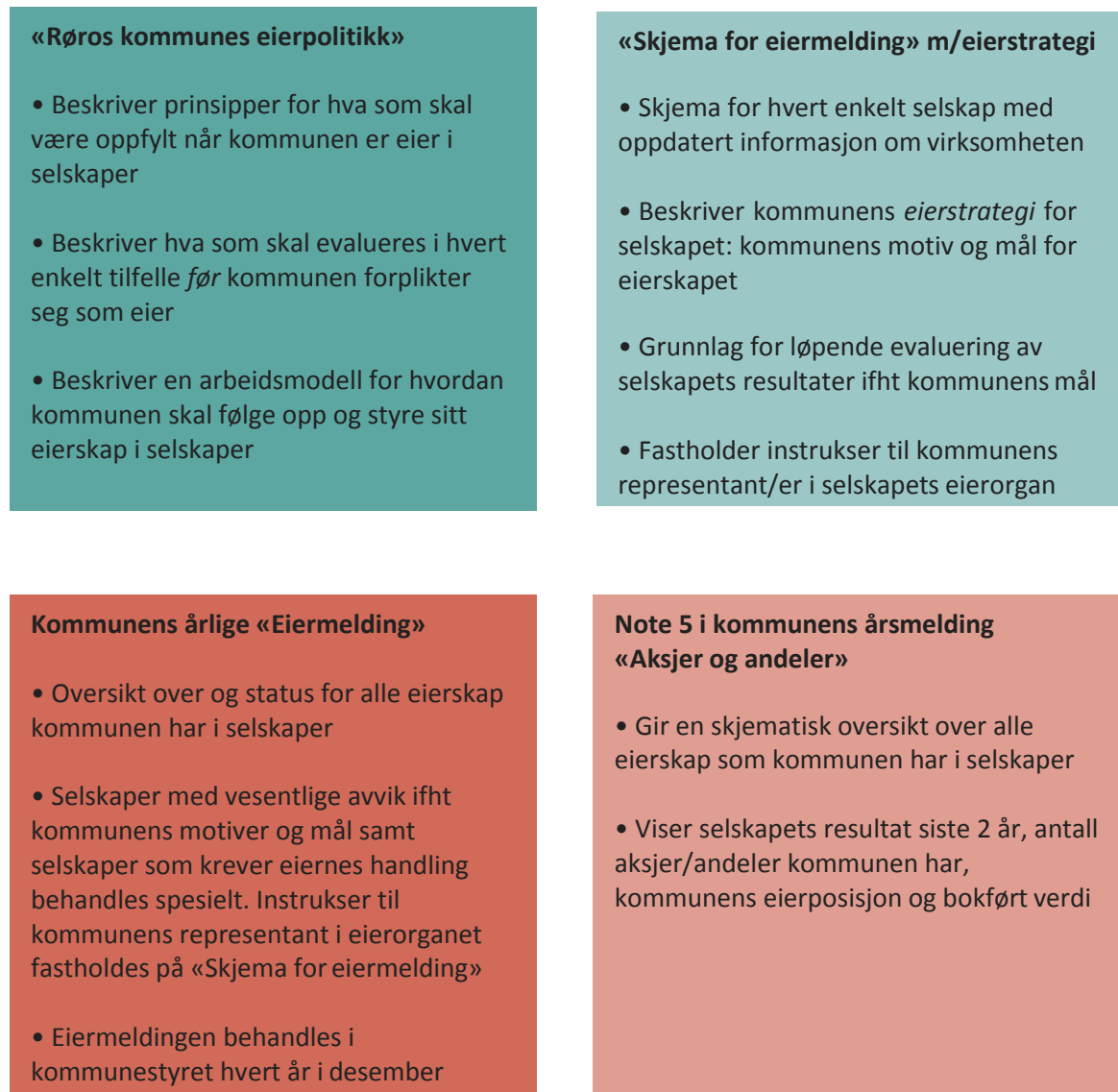
Figur 1- Dokumentstruktur for forvaltning av eierskap i Røros kommune

Oversikt over dokumentstrukturen for styring og forvaltning av kommunens eierskap i selskaper: